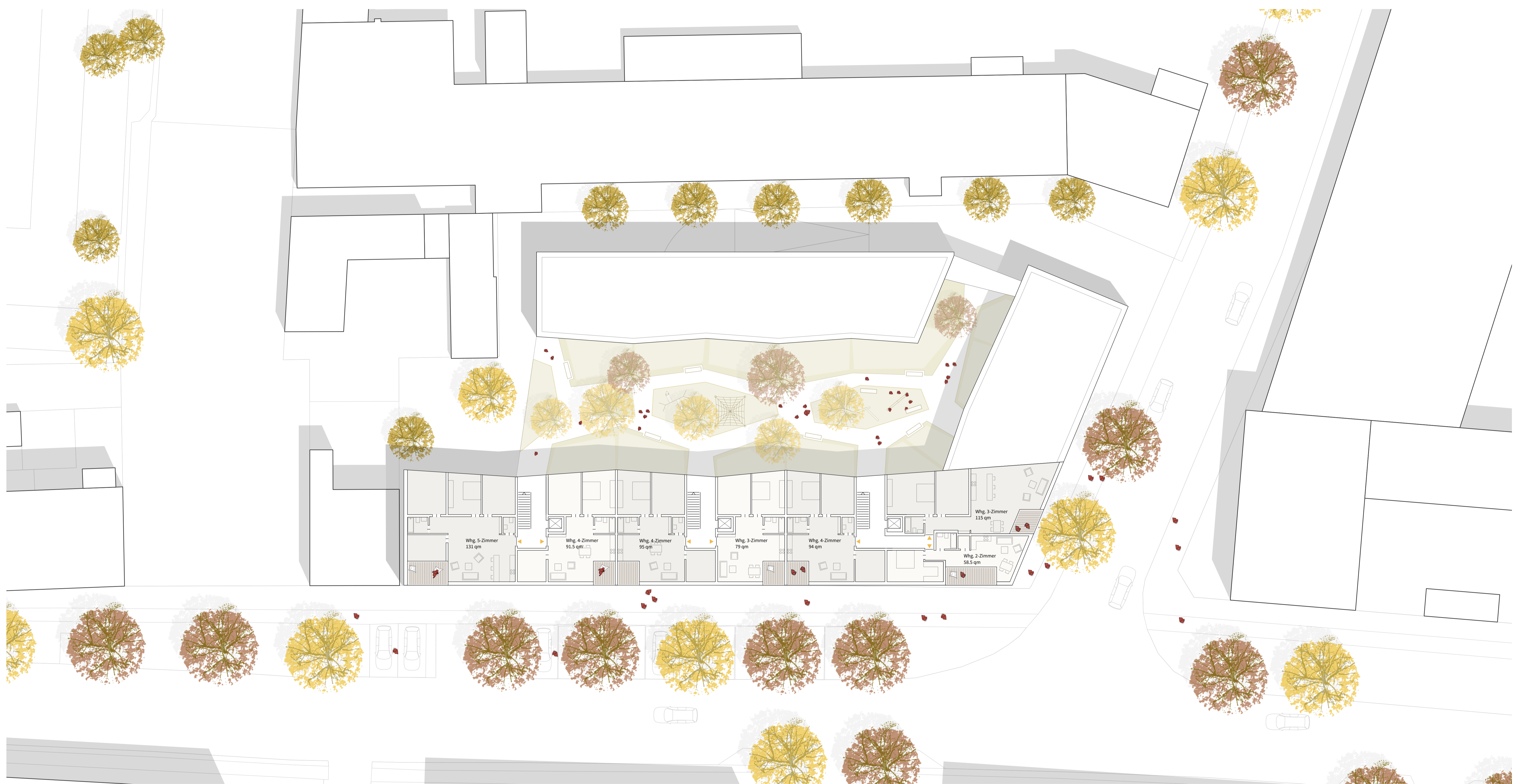
Grundrisse Regelgeschoss 4.OG / 5.OG M 1:200