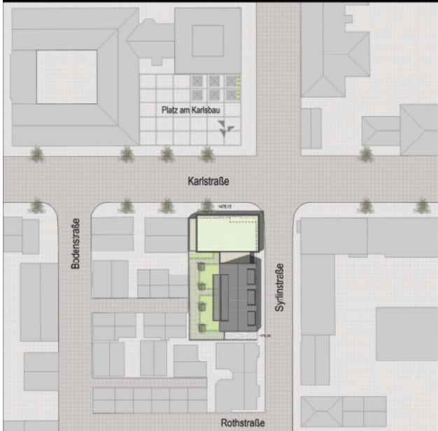
Lageplan / M 1:500