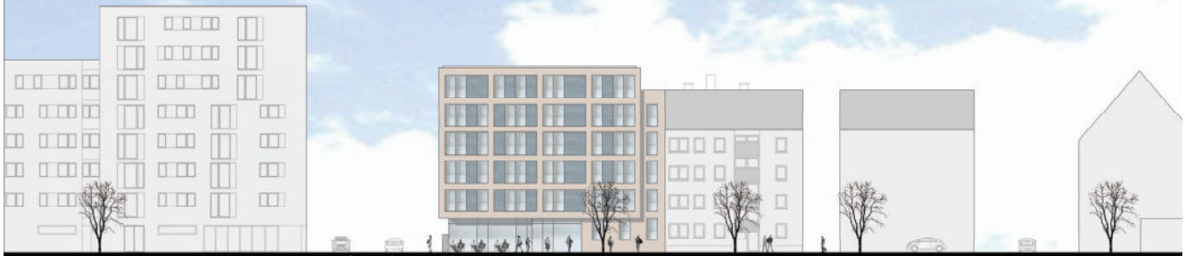
Ansicht Nord - Karlstraße