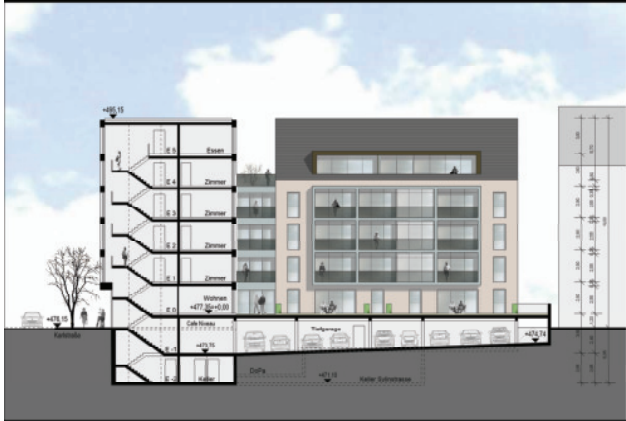
Schnittansicht West - Karlstraße