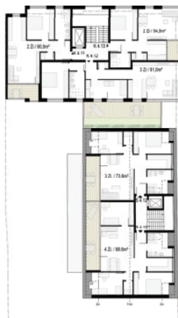
Grundriss Ebene 4 / M 1:200