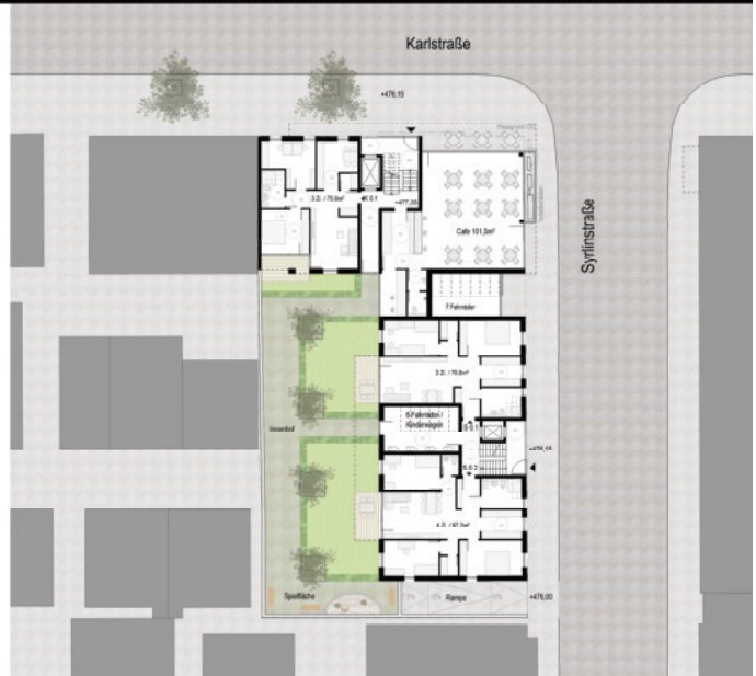
Grundriss Erdgeschoss E0 / M 1:200