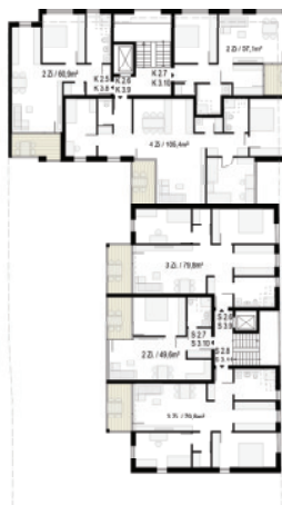
Grundriss Ebene 2+3 / M 1:200