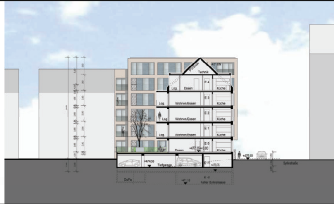
Schnittansicht Süd - Syrlinstraße