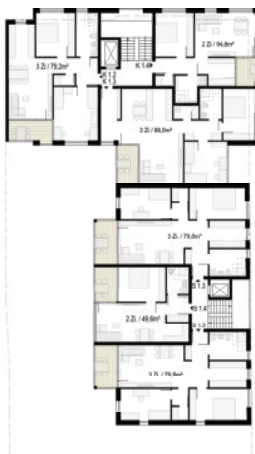
Grundriss Ebene 1 / M 1:200